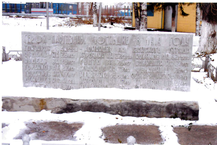
Видовая точка № 2. Стела с именами погибших партизан.