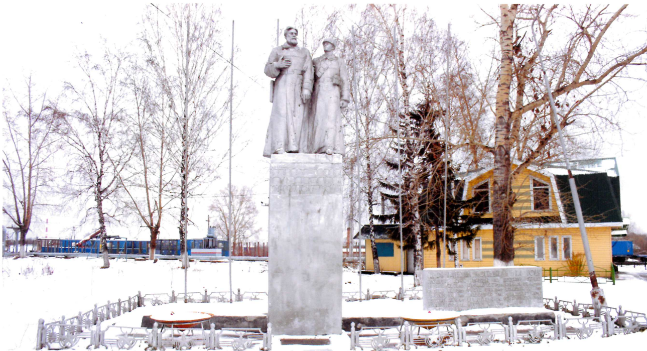
Видовая точка №1. Братская могила партизан в г. Асино на Привокзальной площади.

дата съемки: 17.10.2015 г.