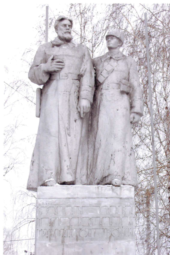
Видовая точка № 4. Скульптура.